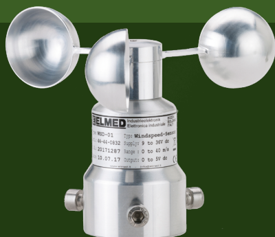
ANEMOMETER FÜR DIE WINDSTÄRKE