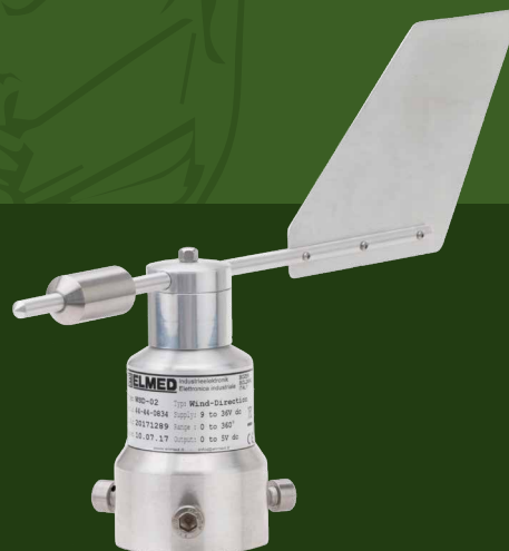
SENSOR FÜR DIE WINDRICHTUNG